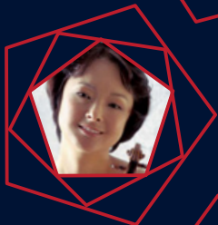
川田知子◆ (ヴァイオリン)